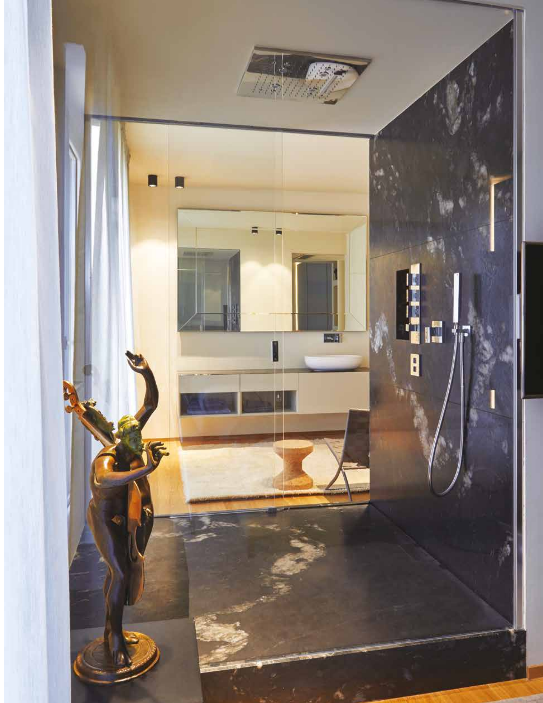
In alto: lo spazio spogliatoio e un particolare del bagno: la grande specchiera Boffi che amplia le dimensioni e rende speciale l'ambiente. A destra: il bagno padronale è un mix di bellezza, design e accoglienza: la doccia è realizzata interamente su misura da Zenucchi Arredamento, sia per la cabina in cristallo che per la base. Il materiale della base è un granito Black Cosmic. Sanitari Boffi e rubinetteria Gessi. Faretto a plafone neri anche nella zona bagno, in armonia con tutta l'abitazione.