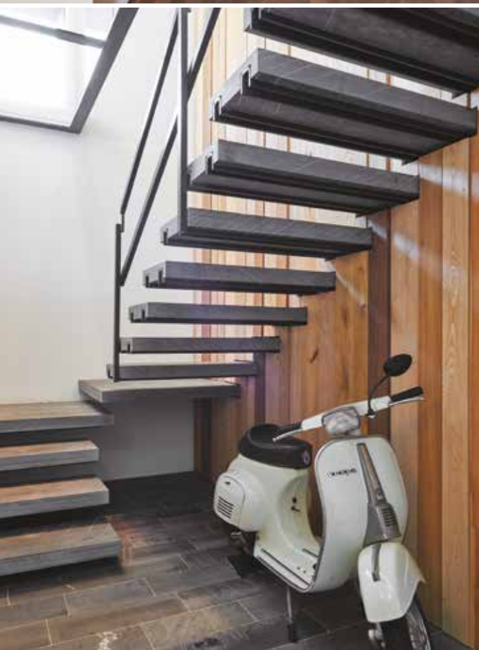
A destra: le camerette dei bambini. La composizione delle scrivanie è Molteni & C. Le due camerette sono comunicanti tramite una grande porta scorrevole laccata che permette di creare un ambiente unico in cui i ragazzi possono condividere le attività e comunicare (Zenuchi Arredamento). A sinistra: la scala porta al piano interrato dove si sviluppa la sala giochi, la lavanderia e il garage.