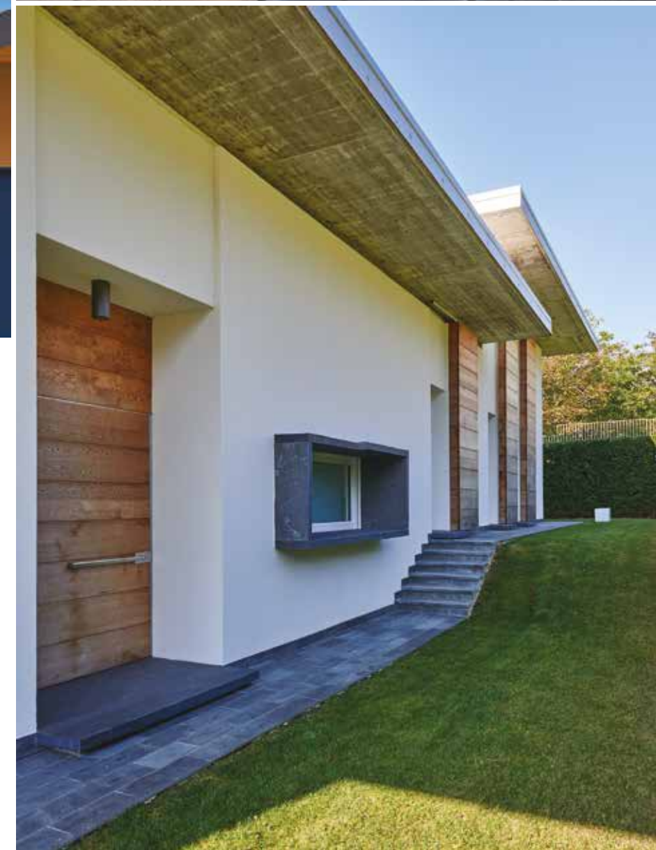
Alcune immagini suggestive della casa: un profondo porticato caratterizzato dalla pavimentazione in pietra che prosegue dall'esterno verso l'interno crea un ampliamento naturale della zona giorno. La pietra usata per il rivestimento è una pietra locale (Zenucchi Arredamento).