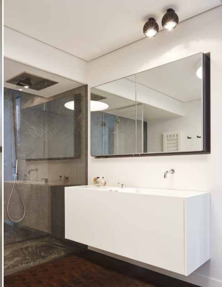
La camera padronale è servita da una cabina armadio e un bagno padronale con doccia e vasca. In queste immagini alcuni elementi che accompagnano la camera padronale: il mobile contenitore, la zona bagno con la vasca e il lavabo (Zenucchi Arredamento).